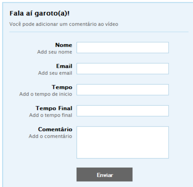
Figura 1. Formulário de cadastro do XML.

O sistema gera como saída um formulário XML, contendo os comentários sobre o vídeo em questão em cada comentário há a identificação do usuário, o tempo a que se refere o comentário, e o texto comentário, a identificação (ID) do comentário será a data e hora que ele foi inserido.